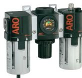
Filtres, régulateurs, lubrificateurs Pour la gamme complète, consultez notre catalogue accessoires