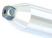
LA437-1D 92966407 Buse 2,4 mm