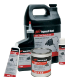
Lubrifiants Pour la gamme complète, consultez notre catalogue accessoires