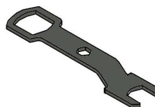
LA437-36 04200549 Clé