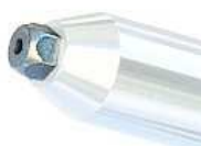
LA437-1B 92966423 Buse 4,0 mm