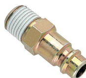
77NMC2 88104070 Embout Gamme 7N7/7S7, filetage mâle 1/4", passage 7,2 mm (EURO 7,2 - 7,4)