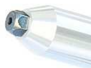
LA437-1C 92966415 Buse 3,2 mm