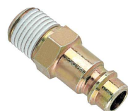
IB6NMC2 88103015 Embout Gamme IBN/IBS, filetage mâle 1/4", passage 6 mm (ISO6150B / MIL-C4109)