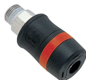
Raccords Rapide Pour la gamme complète, consultez notre catalogue accessoires