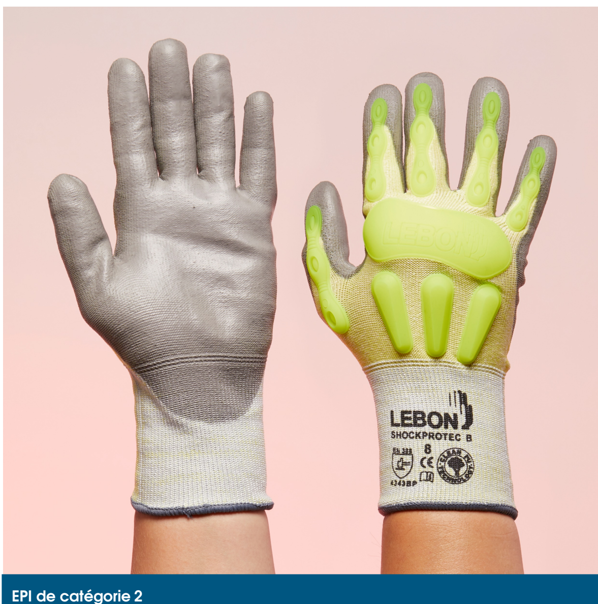
EPI de catégorie 2