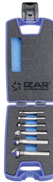
Set 6 Pcs

Recubrimiento bajo demanda Coating upon request Revêtement sur demande