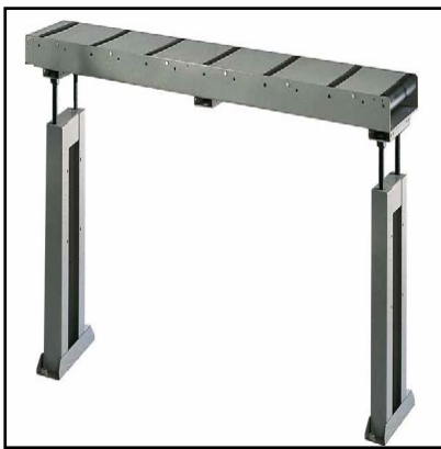
Table à rouleaux de chargement/déchargement (Optional) OPTIONAL

Premier élément compatible pour coté de chargement et coté de déchargement. Longueur 2m, charge utile 700 kg.