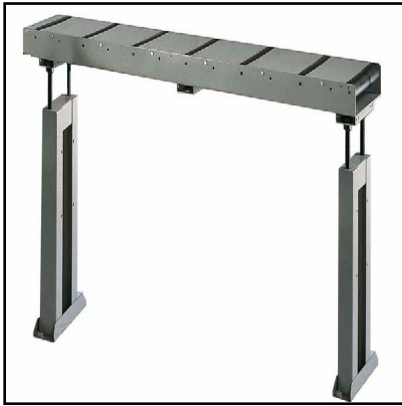
Table à rouleaux de chargement/déchargement (Optional) OPTIONAL

Premier élément compatible pour coté de chargement et coté de déchargement. Longueur 2m, charge utile 700 kg.