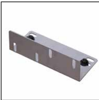
Connexion pour table à rouleaux (Optional)

Élément de soutien à hauteur réglable de 710 à 1100mm. Largeur 260mm, charge utile 150kg