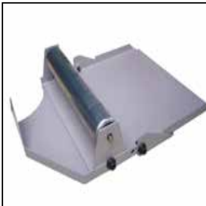
Connexion pour table à rouleaux de déchargement (Optional)

Élément de connexion pour table à rouleaux de chargement.