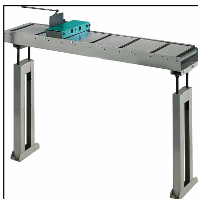
Table à rouleaux de déchargement (Optional) OPTIONAL

Élément suivant pour table à rouleaux compatible avec coté de chargement et déchargement longueur 2m, charge utile 600kg.